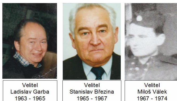
Obr. 4 Velitelé 1963 - 1974