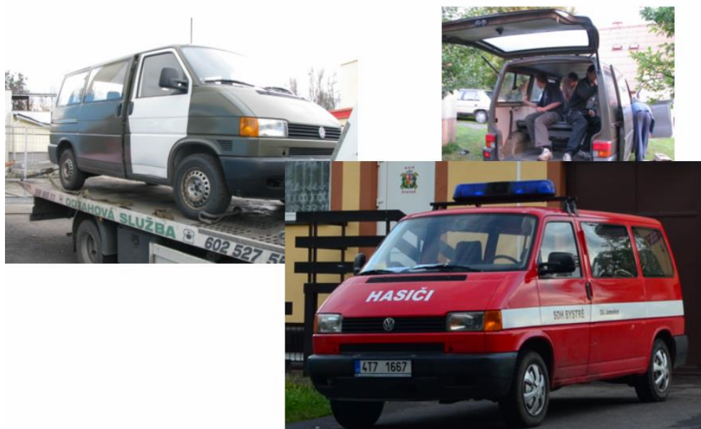
Obr. 11 Současný automobil

Díky bývalému veliteli p. Ladislavu Garbovi vstoupila naše osada Bystré do svazku obcí s názvem Bystré. Setkání Bystranů jsme se zúčastnili v roce 2010 v Orlických horách. Mile nás překvapila pohostinnost Bystranů a program, který byl pro účastníky připraven. V roce 2012 se konalo setkání právě u nás. Do akce se zapojilo přes 80 lidí. Zde je na místě poděkovat obecnímu úřadu za dotaci 200.000 Kč a mnoha malým sponzorům za dary i peníze, bez kterých by tato akce nebyla uskutečněna.