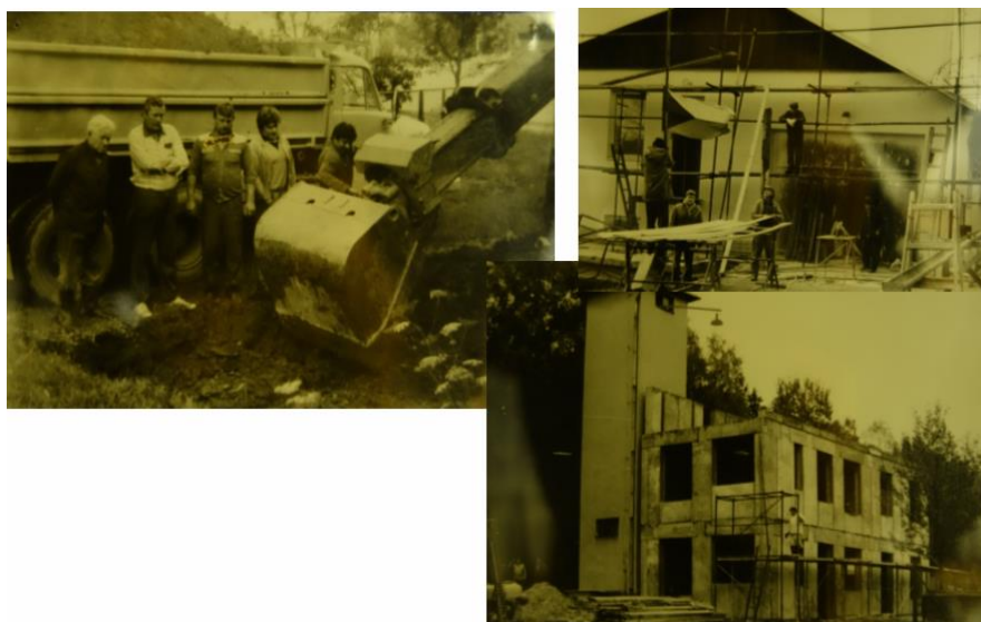
Obr. 8 Přístavba hasičské zbrojnice