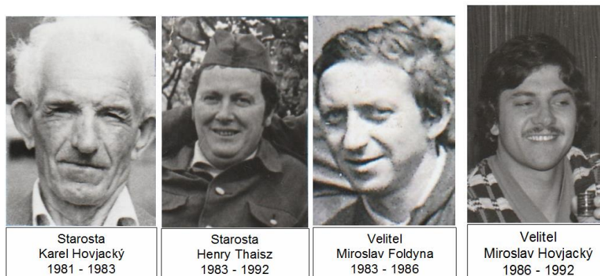
Obr. 7 Vedení SDH 1981 - 1992