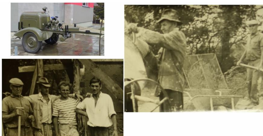
Obr. 2 Stavba garáže.