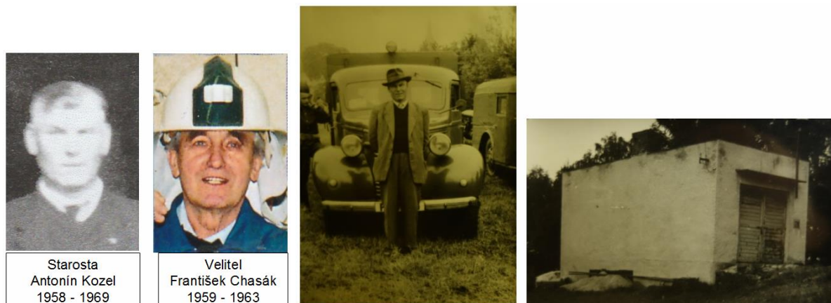
Obr. 3. První vozidlo, dostavba garáže.